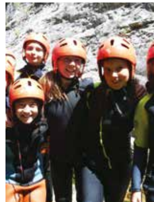
LA TORRA (La Baronia de Rialb, Lleida)