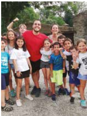
L'ARMENTERA (L'Esquirol, Barcelona)