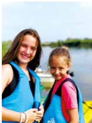
AMPOSTA PARC (Amposta, Tarragona)