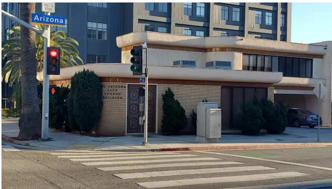
Vistes de l'edifici des de fora

El centre on es realitzaran les classes es troba a una ubicació privilegiada: al veïnatge de Thrid Street Promenade, al centre de Santa Mònica. L'escola ocupa tot un edifici a Arizona Avenue i compta amb una vista pintoresca del centre de la ciutat.